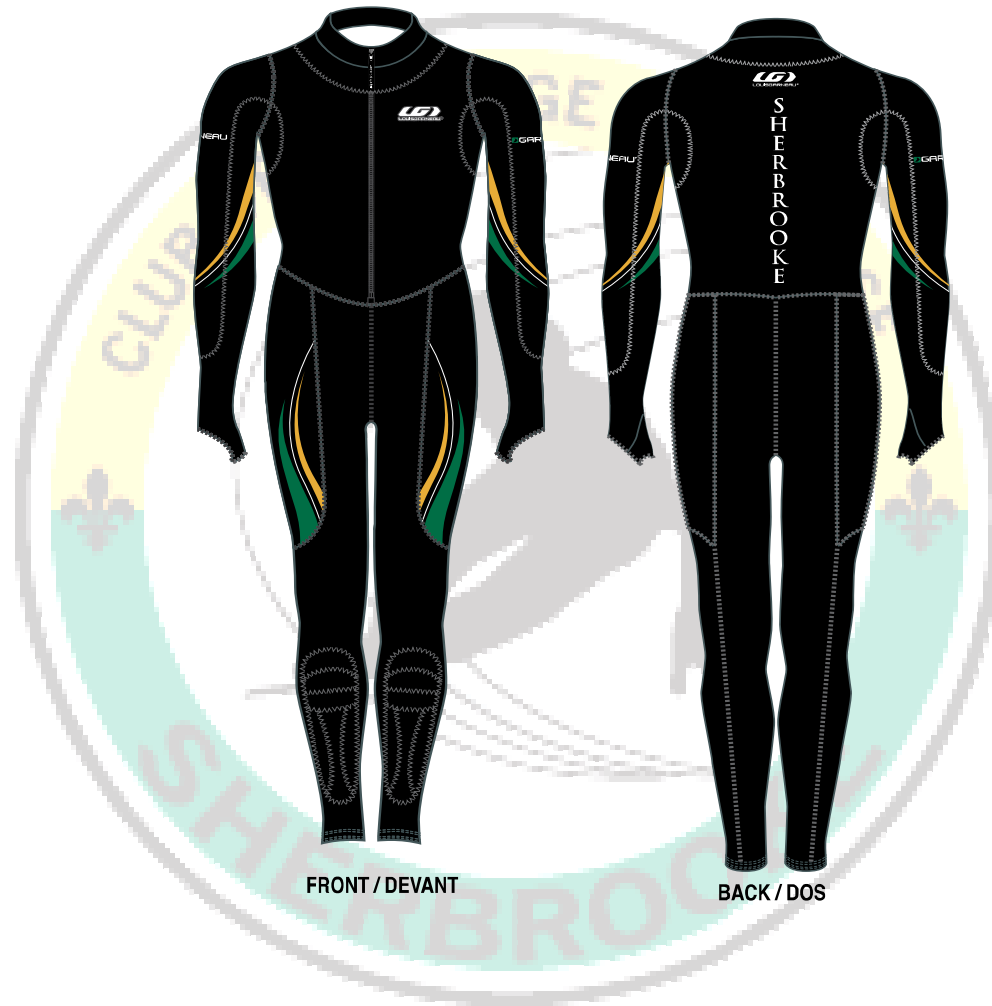
FRONT / DEVANT